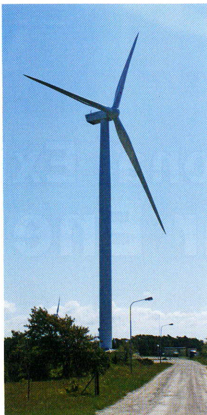
Die ersten Kenersys-Anlagen vom Typ K100 stehen auf Gotland.